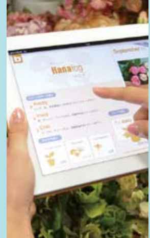
iPadによるアプリケーションの配信