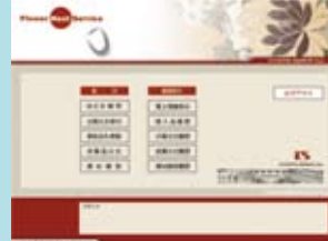
インターネット取引メニュー画面